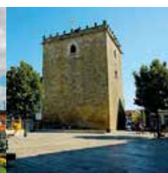
Câmara Municipal de Barcelos

Esta visita, promovida pelo Departamento de Turismo da Câmara Municipal de Barcelos, realizar-se-á perante inscrição de interessados.