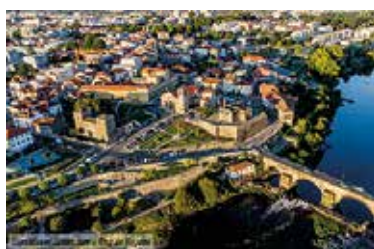
Centro Histórico de Barcelos