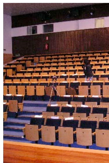
Auditório, Museu da fotografia

É assim, sempre foi assim. Uma boa parte do ProfMat, é garantida por esta intervenção da iniciativa dos que nele vão participar, sinal da sua vontade de mostrar o trabalho que fazem, de trocar ideias e discutir. Sinal, certamente também, de que é assim que entendem um encontro de professores para professores.