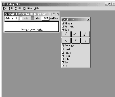
Fotos retiradas na sala de informática.