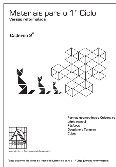
Cadernos 1 e 2 da nova pasta de materiais para o 1º ciclo.